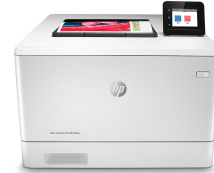
HP LaserJet Pro color M454dw

Această imprimantă este concepută să funcționeze numai cu cartușe cu cip HP nou sau reutilizat și utilizează măsuri dinamice de securitate pentru blocarea cartușelor cu cip non-HP. Actualizările periodice ale firmware-ului mențin eficiența acestor măsuri și blochează cartușele care au funcționat anterior. Un cip HP reutilizat permite utilizarea cartușelor refolosite, recondiționate și reumplute. Mai multe informații la: http://www.hp.com/learn/ds