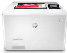
HP LaserJet Pro color M454dn

Pentru o afacere de succes trebuie să lucrezi inteligent. Imprimanta HP Color LaserJet Pro M454 este creată pentru ca tu să dedici mai mult timp acolo unde este nevoie pentru a-ți dezvolta afacerea și a te detașa de concurență.